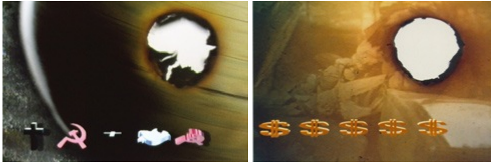
“Frame, o la rueda de la fortuna”: https://vimeo.com/16650945